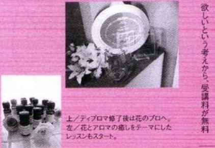
上/ティプロマ修了後は花のプロへ。左/花とアロマの癒しをテーマにしたレッスンもスタート。

最近の活動と今後の展開 近年開設されたプリザーブドフラワーとアロマフラットの2つが同時に習えるレッスン「フラワー＆アロマライフレイトコース」は花とアロマを気軽に取り入れたワンランク上のライフスタイルがテーマ。今後はそつと、癒しを取り入れたレッスンも積極的に行われる予定だそうです。また、11月中旬からは、各認定教室にてクリスマスチャリティレッスンの開催予定もあり、ますます活動の幅を広げていく兆し。 生徒一人一人と向き合ったきめ細やかなサポートと多彩な活動が魅力のフラワーアートクリエイター協会、今後の更なる活躍に期待できます。